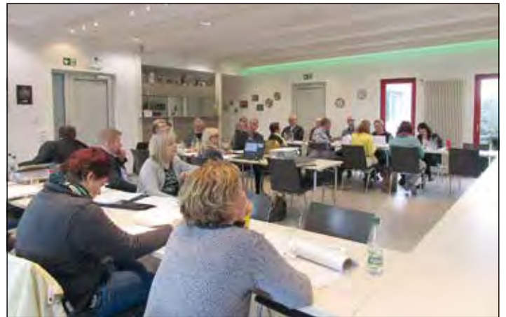
Tagung der Entscheidergruppe der LAG Sagenhaftes Vogtland am 19.04.2016 in der Freiwilligen Feuerwehr Ellefeld

Austausch/Neubestückung von Wanderbänken oder weiterer Verschönerungsmaßnahmen in den beteiligten Gemeinden), welche im Konzept vorher festgeschnürt wurden.