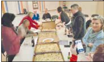
Ausklang gab es im Vereinsaal Pizza für alle und ein gemütliches Beisammensein.