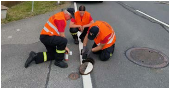
Kameraden der FFW Bergen bei der Hydrantenkontrolle

Bleibt zu hoffen, dass noch lange auf einen Zugriff auf die Hydranten verzichtet werden kann und unser Ort auch weiter von größeren Sach- oder gar Personenschäden verschont bleibt.